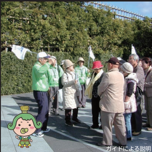
ガイドによる説明