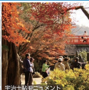
宇治十帖モニュメント