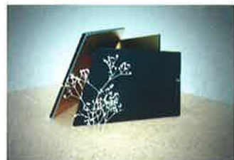
久御山町一坪茶室 完成予想模型

企画制作協力：京都工芸繊維大学、京都精華大学、京都美術工芸大学、京都文教大学、京都伝統工芸大学校、嵯峨美術大学、成安造形大学、東京藝術大学 北川原温研究室、同志社大学 京都と茶文化研究センター、東京大学川添研究室、龍谷大学 (五十音順)