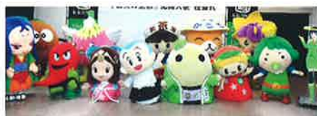
京きやら (山城ご当地ゆるキャラ)

宇治田楽まつり/茶カクテルショー/お茶当てゲーム/オカリナ演奏 木管三重奏/京きやら (山城ご当地ゆるキャラ) 大集合 京都やましろ観光大使 AKB48 横山由依 開会宣言 (10/21 10時予定) など