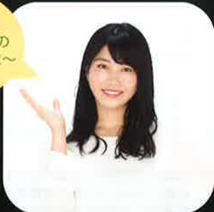
京都やましろ観光大使 AKB48 横山 由依